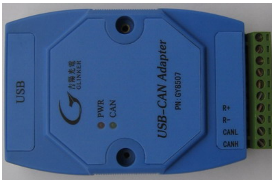
图 1 USB-CAN 外观

绿色 LED-CAN 指示 CAN 接口状态。每当接收或发送 CAN 总线数据时，绿色 CAN 灯会闪烁。具体如下图所示：