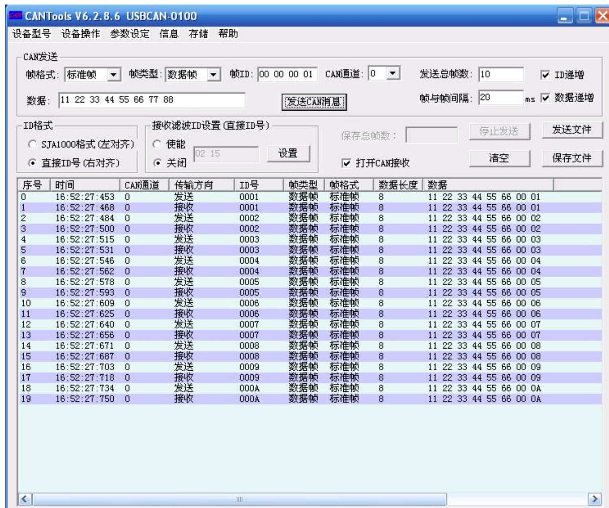
图 4 运行工具软件 CANTools.exe