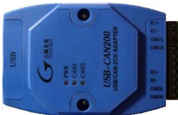
图 1 GY8508 外观

绿色 LED-CAN 指示 CAN 接口状态。每当接收或发送 CAN 总线数据时，绿色 CAN 灯会闪烁。具体如下图所示：